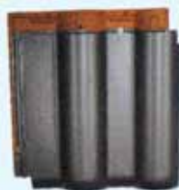
(メタリックブラック) metallic black