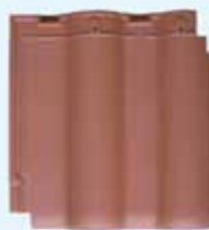
(テラコッタ) terra cotta