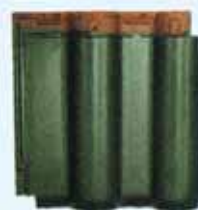
(モスグリーン) moss green